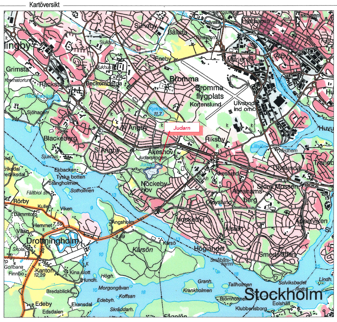
Skala 1:50 000. Ur Gröna kartan, © Lantmäteriverket, Gävle 2001. Medgivande M2001/1212.

5 2 Djupangivelser i meter decimeter ----- 0,5 m ekvidistans