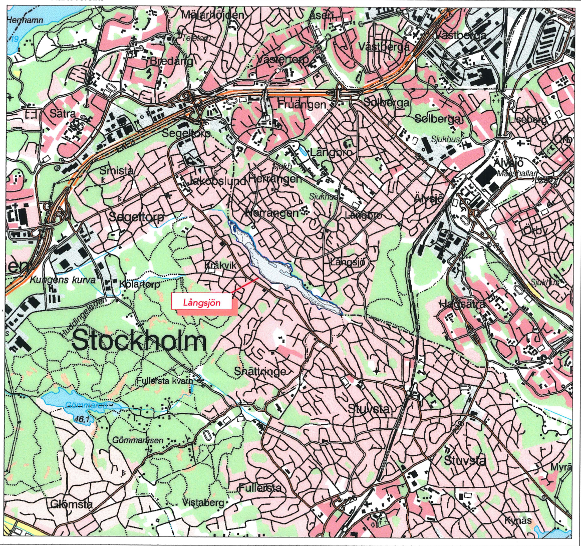
Skala 1:50 000. Ur Gröna kartan, Medgivande 507-99-2149.