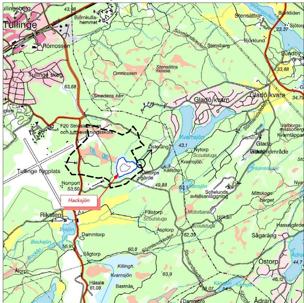
Kartöversikt med avrinningsområdet

Skala 1:50 000. Ur karta © Lantmäterverket Gävle 2002. Medgivande M2002/5648.