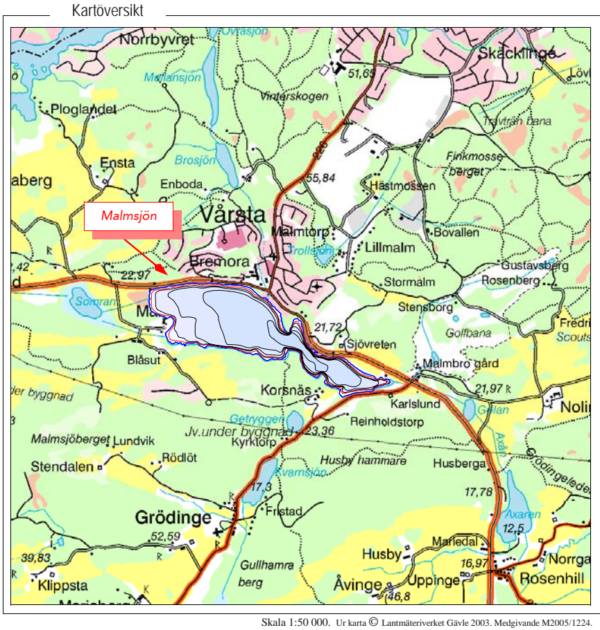
Skala 1:50 000. Ur karta © Lantmäteriverket Gävle 2003. Medgivande M2005/1224.

Strandlinjen © Lantmäteriverket, 2005. Ur GSD-Geografiska Sverigedata, Dnr 106-2004/188-D.